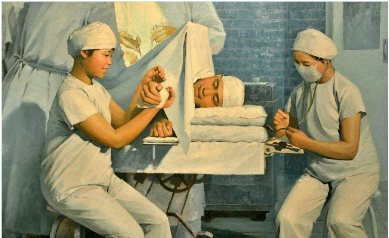
针灸麻醉最多只能作为一种辅助麻醉手段

剖腹产的产妇做针刺麻醉的奇观。这可谓是一场彻头彻尾的政治表演，事实上那些接受针刺麻醉的病人都是经过严格挑选的，比如挑选那些比较容易接受心理暗示，且对疼痛耐受力较高的病人，并且在进行针刺麻醉之前要求病人把这当成为国争光的政治使命，务必要有坚强的革命意志，不能喊疼，甚至在针刺麻醉以前偷偷地给病人打麻醉剂。因此，虽然在此之后国际上掀起了一阵针灸热，针灸麻醉却并没有进入主流医学的殿堂，而是依旧作为一种替代医学或者另类医学手段而存在，并且直到现在依然处于一种非常小众的地位，最多仅是在麻醉剂麻醉时作为辅助手段而存在。至于那些吹嘘针灸能够减肥、祛痘等等的研究则更是可笑到不知科学研究为何物，连被拿来分析一番的资格都不具备。